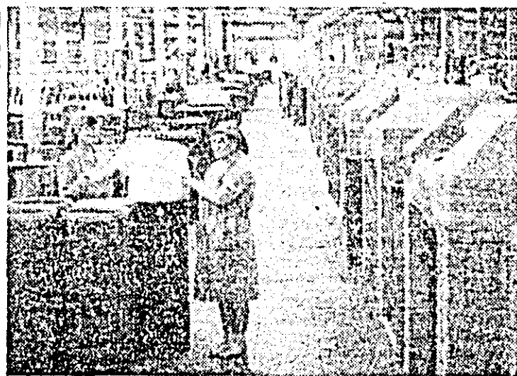
Aspect de muncă în fila tura întreprinderii textile.