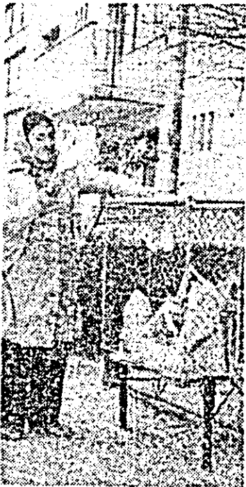
Chișineu Criș, str. Înfrățirii 96, bloc B. La fel ca la alte blocuri ziarele, revistele, cutiile de detergenti etc. sînt colectate în containere.

Concluzia se impune de la sine: atunci cînd primăria se implică nemijlocit în recuperarea materialelor refolosibile, rezultatele nu pot fi decît bune.