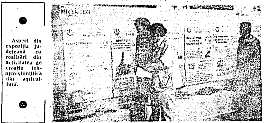
Aspect din expoziția județeană cu realizări de creație tehnico-științifică din agricultură.