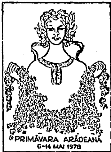
PRIMĂVARA ARĂDEANĂ 6-14 MAI 1978

marele public iubitor de frumos, contribuind, totodată, prin arta lor la educarea patriotică și estetică a oamenilor muncii. În cadrul festivalului cultural-artistic „Primăvara arădeană”, oamenii de cultură, cadrele didactice, artiștii profesio-