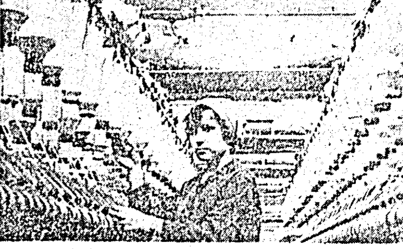
În secția ringuri a unității „30 Decembrie” de la Combinatul textil.