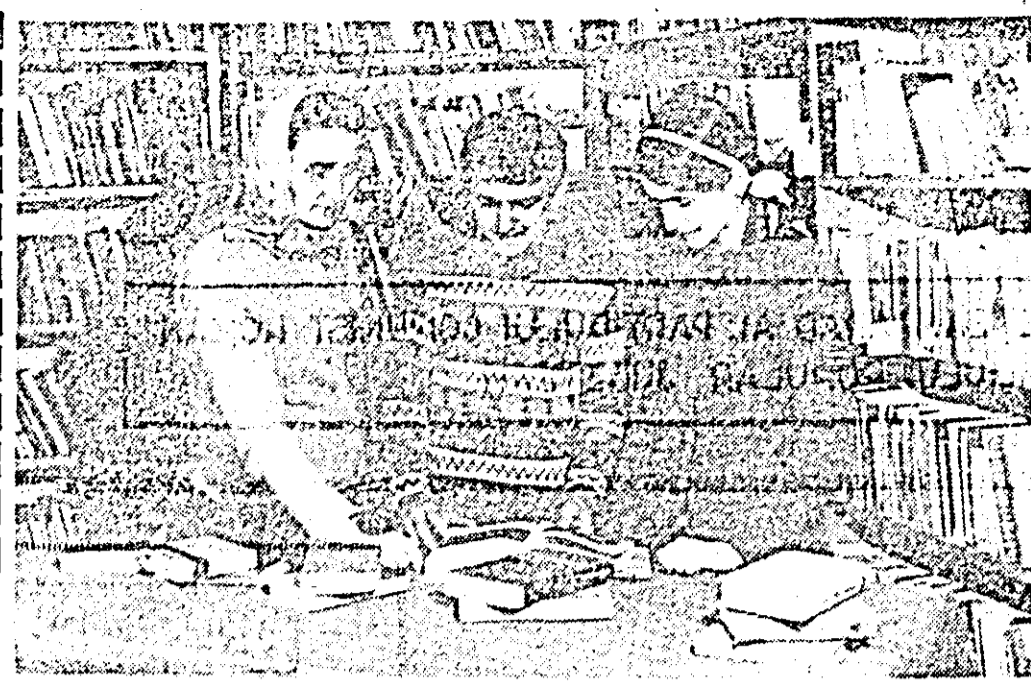
Lectura — pasiunea tineretului. Instantaneu fotografic la Biblioteca din comuna Șilindia.