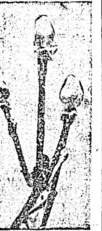
Semnele primăverii.

Convorbire realizată de: ELENA JUCU (Cont. în pag. a III-a)