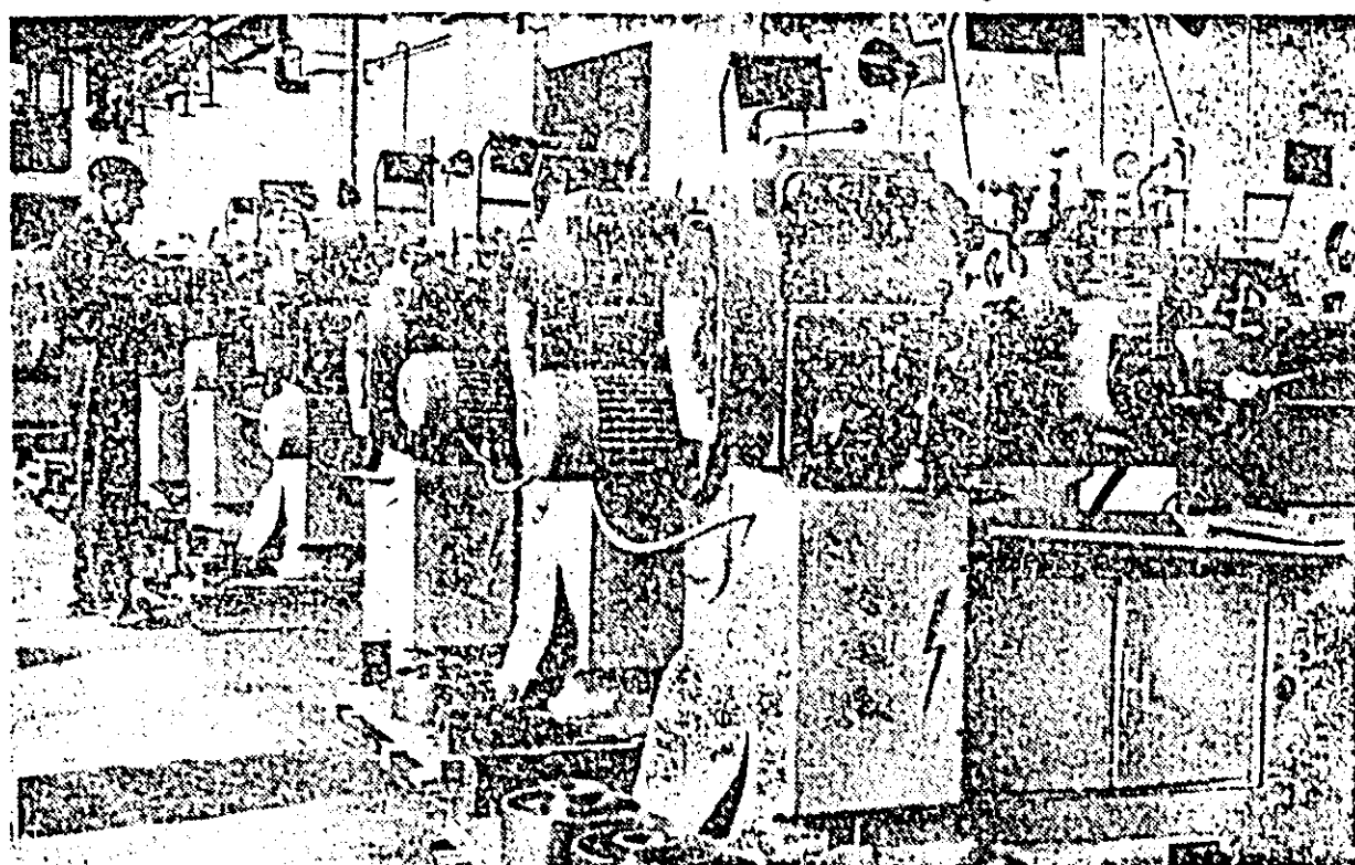
Uzina de strunguri: un nou lot de strunguri e pregătit pentru a lua calea beneficiarilor.