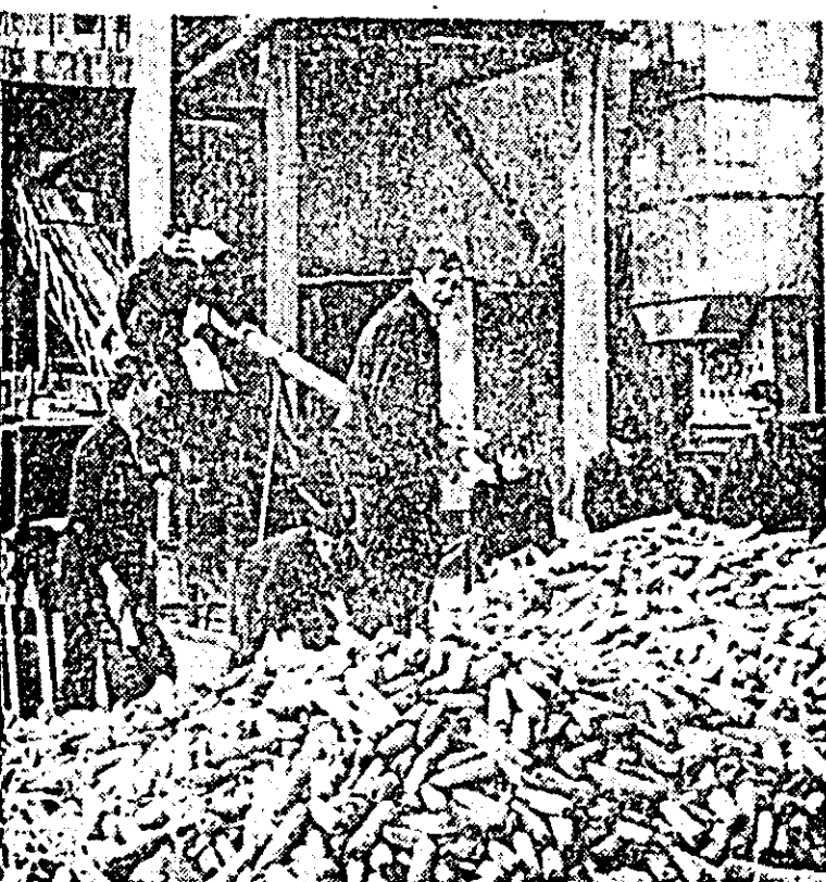
La baza de recepție din Calea Curticului, Arad. Și elevii au venit să dea o mîna de ajutor la depozitarea porumbului.

confecții în valoare de 500 mii lei, zahăr și alte numeroase produse. Prin depășirile realizate colectivele de muncă din județul nostru fac pași fermi și siguri spre depășirea prevederilor planului anual și a angajamentelor asumate în întrecerea socialistei, pun baze materiale puternice îndeplinirii ciclului înainte de termen.