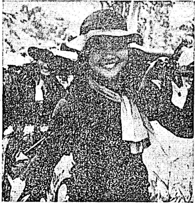
VIETNAMUL DE SUD: Luptătorii ai armatei de eliberare întorcându-se triumfători dintr-o misiune de luptă.