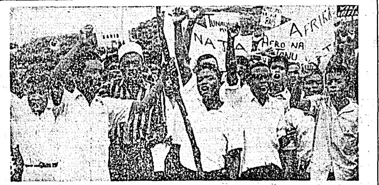
TANZANIA. — Studenții din Zanzibar, au organizat recent o manifestație împotriva amestecului imperialistilor în treburile interne ale țărilor africane.