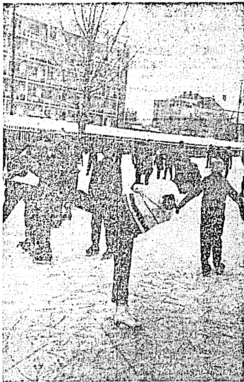
Patinoarul amenajat pe terenul Constructorilor atrage în aceste zile pe iubitorii acestui frumos sport de iarnă — patinajul