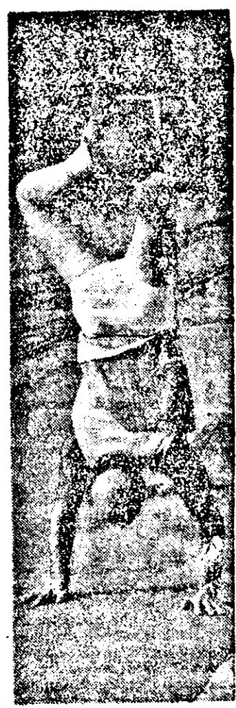
Mare lucru libertatea! Faci ce vrei, umbli cum vrei, stai și... în cap dacă îți place. Chiar și în mijlocul străzii!