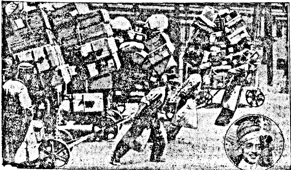
Vizita mareședjului Mysore cu 600 de ge amantane la Roma.

Planul împânzirii orașului cu cât mai multe peluze de verdeață se dovedește a fi o idee strălucită ale cărei rezultate pentru întreaga igienă și estetică a orașului nu vor întârzia să se producă.