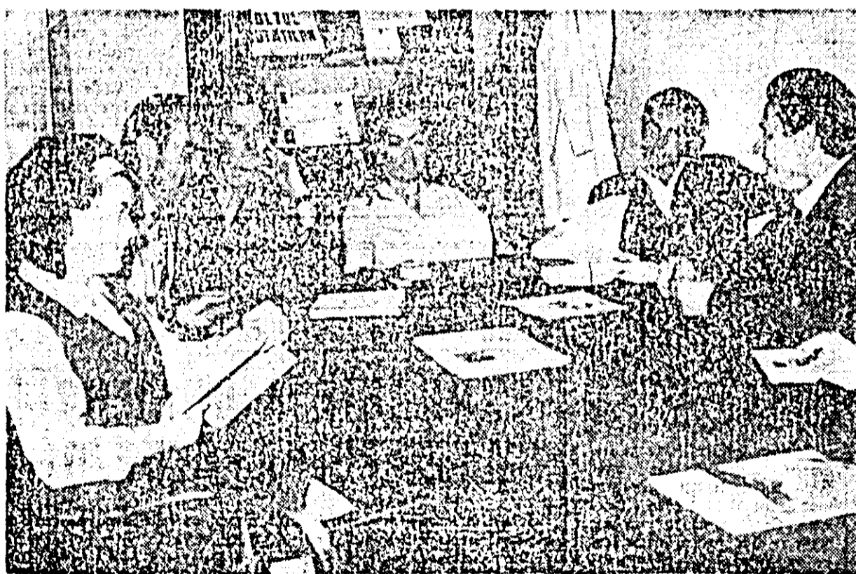
În imaginea de mai sus vă prezentăm un grup de artiști amatori de la Uzinele de vagoane în timpul primelor repetiții la o nouă piesă.

Am intrat în tradiția Teatrului timișorean de păpuși și aduc în fiecare o ceva nou în cadrul repertoriului său, să atenteze întregul colectiv în căutări, care pentru creșterea acestui teatru constituie un aspect pozitiv al activității.