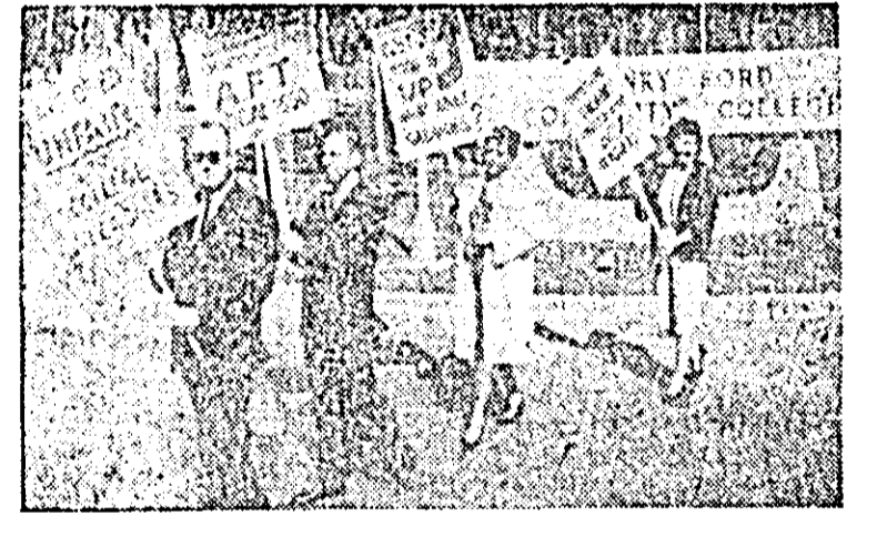
S.U.A. — În statul Michigan, lucrătorii Institutului Dearborn Henry Ford demonstrează pentru îmbunătățirea condițiilor de muncă

Deasupra unor regiuni întinse ale continentului american — din Canada și pînă în Panama — iarna și-a făcut anul acesta o apariție prematură, provocînd victime omenești, inundații, pagube materiale și greutăți în circulație.