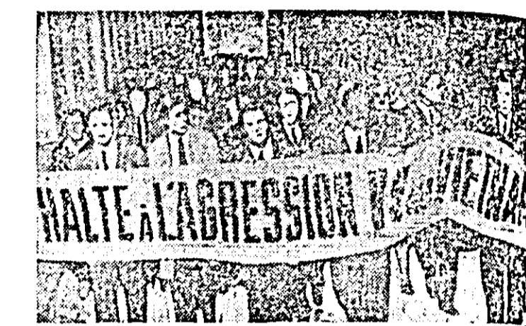
FRANȚA. — La Paris, coloane de manifestații, purtînd lozinci, au cerut încetarea imediată a agresiunii americane în Vietnam.