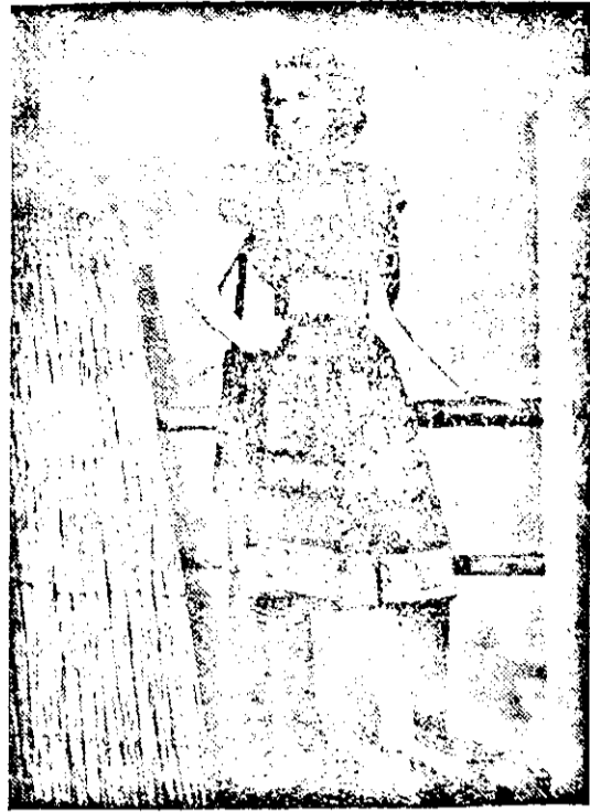
Deutsche Putmode 1943 (Atlantid)

An Stelle des verunfallten Oberkommandanten der USA-Truppen in Europa General Andrews, wurde Brigadegeneral William Rex mit diesem Kommando vorübergehend betraut. (R)