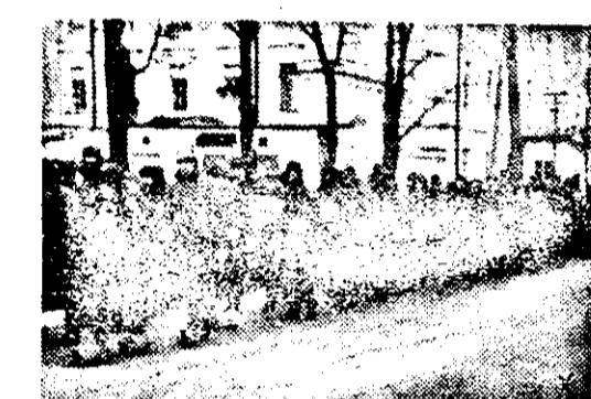
Das sind die Feinde Europas. Bolschewistische Gefangene werden abtransportiert. Auf dem Wege ins Hinterland ziehen die langen Kolonnen der Gefangenen durch die Stadt.