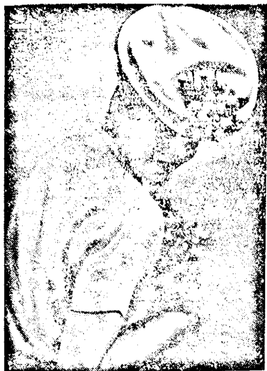
Deutsche Mode 1943 (Atlantid)