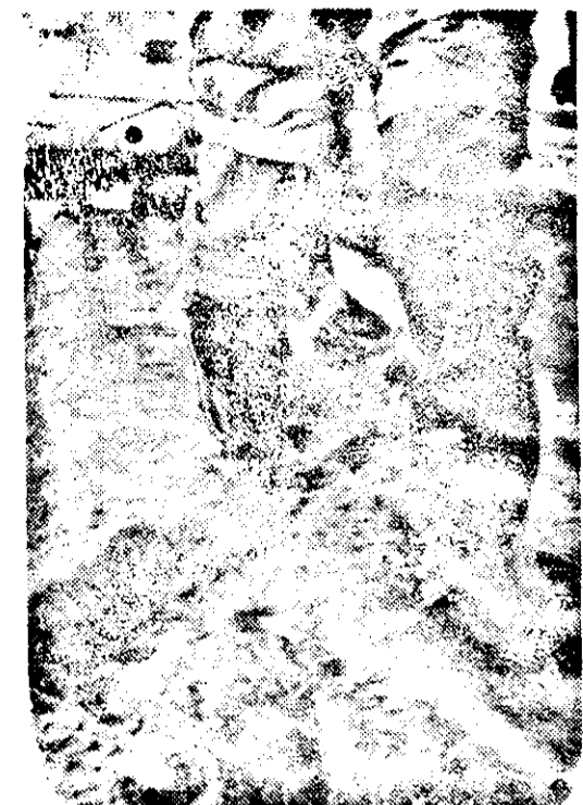
Jeder Soldat merkt es auf „Schritt und Tritt“, daß der Frühling im Osten eingebrochen ist.

Alle wehrfähigen Männer im Alter von 18—35 Jahren sind eingezogen. Ugram. (Gdp) Der Volksgruppenführer der Deutschen Volksgruppe in Kroatien gab bekannt, daß alle wehrfähigen volksdeutschen Männer und Jungen der Jahrgänge 1908—25 zum Fronteinsatz bei der Waffen-SS einrücken. Zwei ein-satzbereite Bereitschaftsbataillone der