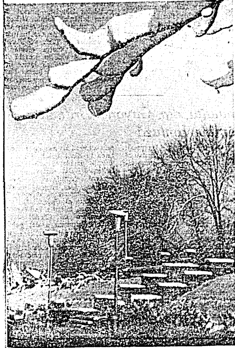
Lucrările în parcul de pe malul Mureșului.