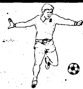
Gremio a jucat 3 meciuri într-o zi!

În turneul internațional demonstrativ de la Fullerton (California), reprezentativa SUA a terminat la egalitate, 1-1 (0-0), cu selecționata Hondurasului. Au marcat Kirovskio '90, respectiv, Velasquez '68. Într-un alt meci, echipa Los Angeles Salsa a învins cu scorul de 4-1 (3-0) formația de tineret a Insulelor Trinidad Tobago. Au înscris: Vasquez '715'34, Harbour '75, respectiv, Pullonias '83.