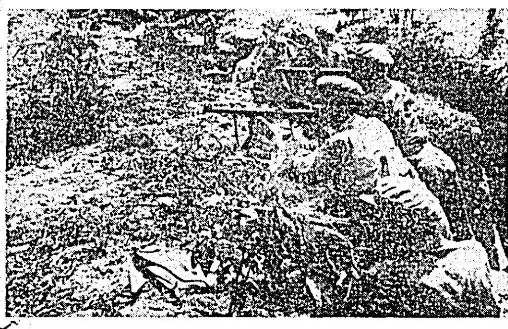
IN FOTO: patrioții laotieni în timpul unui atac, undeva în sudul țării.

PNOM PENH 5 (Agerpres). Forțele de rezistență populară cambodgienă au ocupat din nou, pe o porțiune de 20 de kilometri, șoseaua nr. 4, care leagă portul Kompong Som de Pnom Penh.