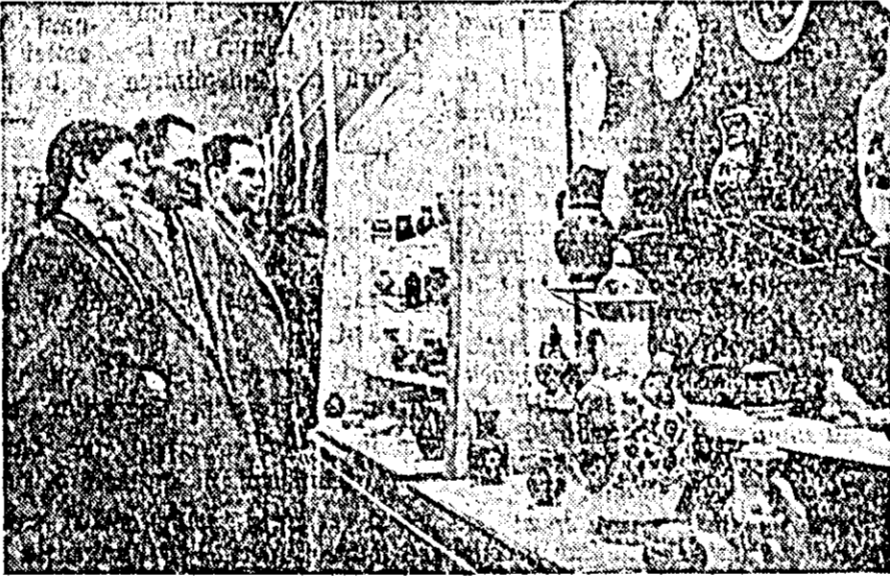
ÎN CLIȘEU: Vizitatorii privesc obiectele de ceramică fabricate în întreprinderile industriale din R.S.S. Estonă.

Cetățenii Moscovei au putut admira minunatele realizări ale operelor de artă decorativă aplicată și produsele fabricate de întreprinderile din republicile baltice expuse în sala de expoziții a Uniunii pictorilor sovietici din Moscova.