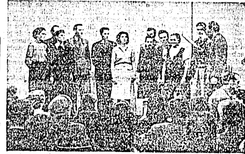
Brigada artistică de agitație are de trecut un examen dificil în fața spectatorilor exigenți.