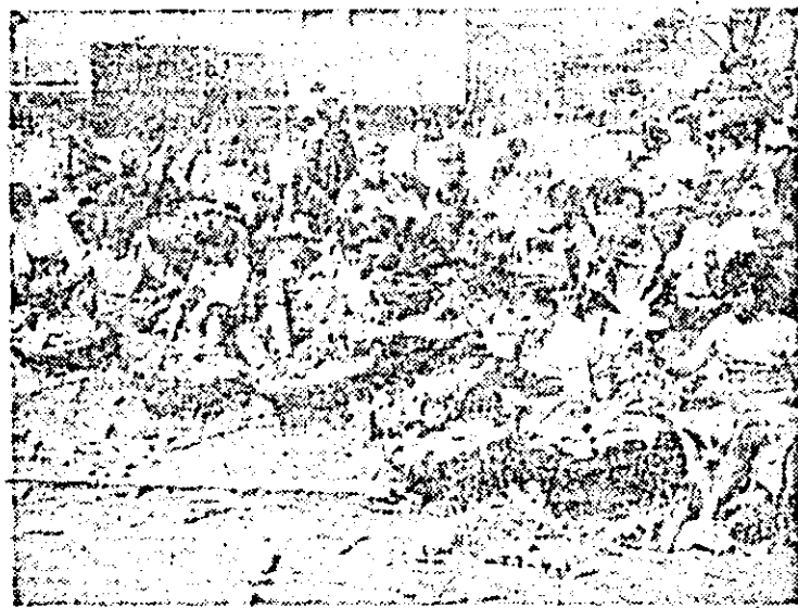
Elevii de la Liceul Industrial Lipova participă în număr mare la depănșatul porumbului la cooperativa agricolă din localitate.

din cele 289 ha s-au cules numai jumătate. De remarcat că primul loc la transportul porumbului la baza de recepție îl ocupă cooperativa agricolă din Gurahont. Conducerea cooperativei organizează bine, pe toată durata zilei, transportul la bază și se bucură de sprijinul efectiv al primarului comunei Gurahont, Vasile Mirescu, care atunci cînd se defectează un agregat mecanic pentru încărcarea porumbului în remorci, sau un mijloc de transport, la începutul zilei, cu întreprinderile de pe raza localității, în urma cărora s-au scos de la depozite necesare astfel ca mîine să nu stagneze nici un moment.