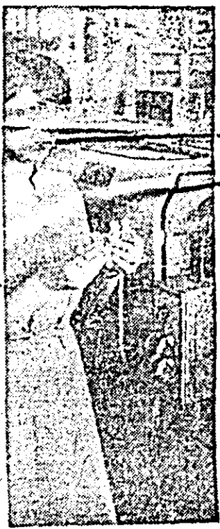
Fruntășă în întrecerea socialistă, comunistă Lucreția Boșneag de la „Ardeanca” se bucură de o frumoasă apreciere în colectivul său de muncă.

Și oamenii muncii din această întreprindere și-au îndeplinit înainte de termen — urmare îndeosebi a concretizării măsurilor prevăzute, pentru perioada trecută de la începutul anului, de programul de modernizare a producției — sarcinile de plan pe nouă luni. Preliminările efectuate la această dată indică faptul că se va realiza o producție marfă suplimentară, pe nouă luni, în valoare de 4300000 lei. Sporul de producție marfă se concretizează într-o producție fizică de 115000 bucăți tricotate și 20000 mp țesături. În context — trebuie menționat faptul că la obținerea acestor rezultate depășiri ale sarcinilor de plan a contribuit deosebită și-au adus-o colectivele de muncă ale atelierelor de produse pentru export al secției din Ineu a întreprinderii, cit și al secției confecții de la „Tricoul roșu”.