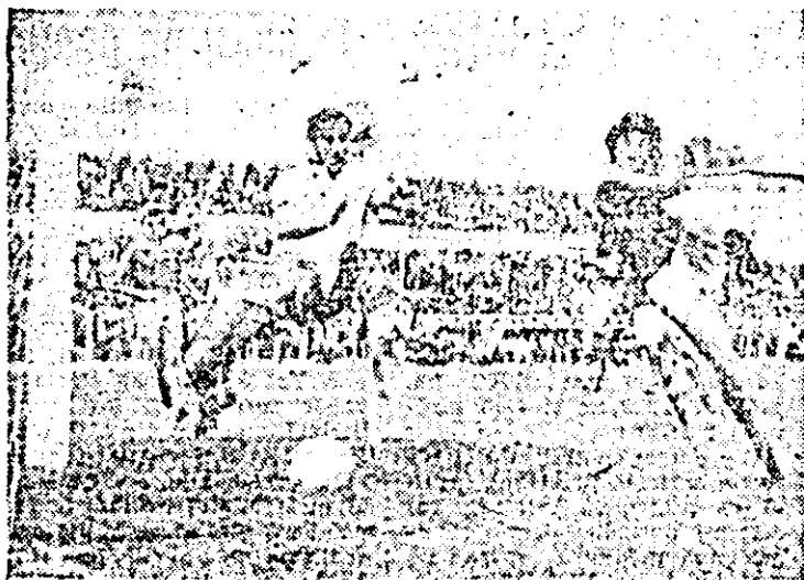
Minutul 68: Vârșandan marchează primul gol, fază din meciul UTA — Steaua CFR Cluj-Napoca.