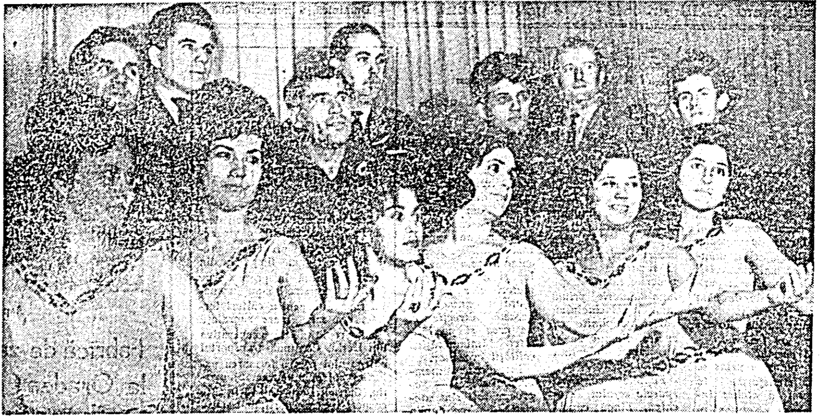
IN CLISEU: membrii formației artistice sindicale a uzinelor textile „30 Decembrie“ cîștigătorii locului II pe țară cu montajul literar „Cintare omului“.