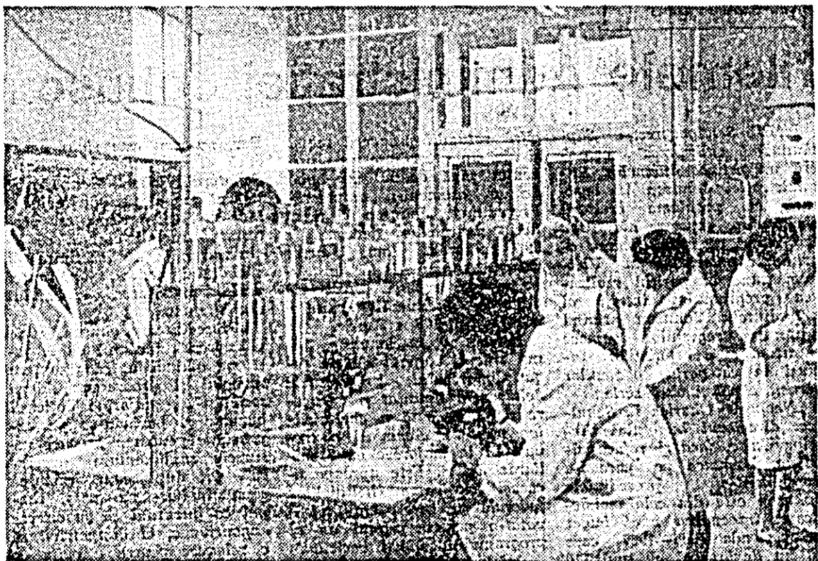
În laboratorul de hidrochimie și ape reziduale al Direcției regionale a apelor Mureș-Banat, închidul INCOLOR este supus unor analize minuțioase. ÎN FOTOGRAFIE: aspect din laborator.