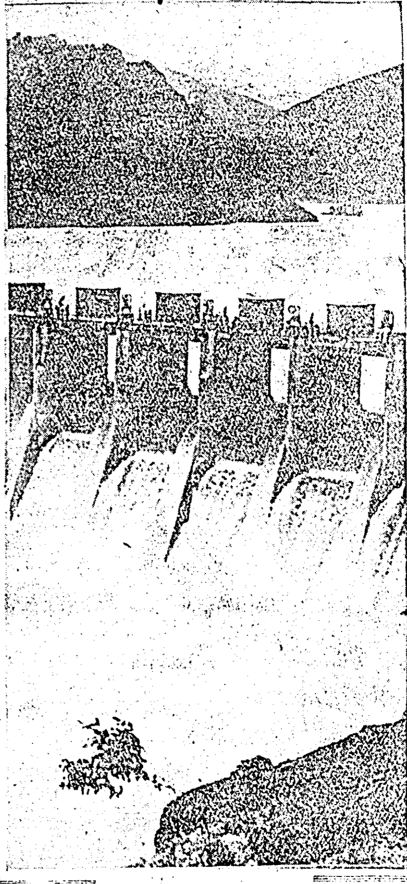
Veșere generală a școlii de acumulare de la Studen din R. P. Bulgaria.