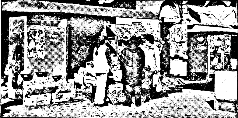
La UTA, mărfurile „mușcă” din trotuar