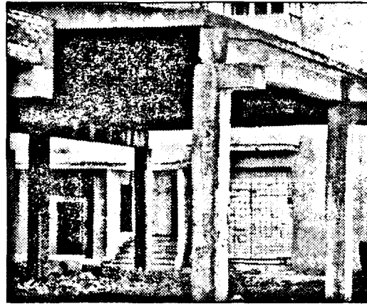
Nimeni nu s-a mai ocupat și de închiderea șantierului, după terminarea lucrărilor...

Spre schimbarea situației, locuitorii cartierului Vlaicu propun o