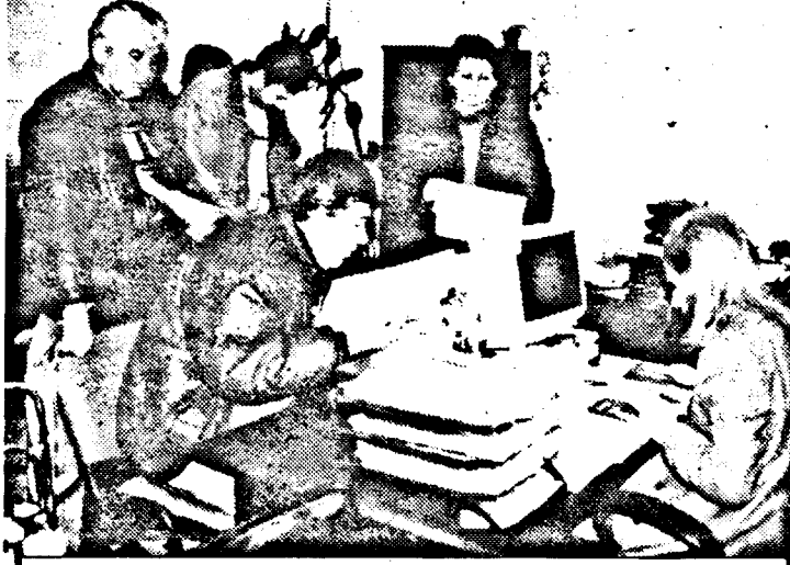
La așa-zisul Birou Unic, coadă ca la moară...

P.S.: Într-un număr viitor al ziarului nostru vom reda și punctul de vedere în această privință al domnului Nicolae Băcanu, președintele Camerei de Comerț și Industrie a județului Arad.