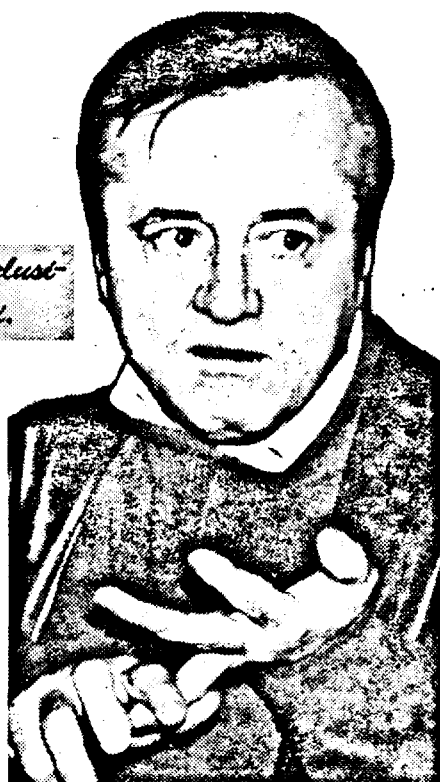
ce-am mai putea face ca să rămânem iarăși doar... candidați?

— Într-adevăr, sunt suficiente semnale conform cărora toate cele șapte state candidate vor fi admise în structurile NATO. Ca să rămânem iarăși candidați, ar trebui să facem câteva prostii monumentale... — N-ar fi prima oară... — Așa este, dar cred că ne-am maturizat suficient. — Ne-am maturizat, dar anglo-americanii ne-au aruncat deja două bombe în cap: Reșița și Galațiul. Prima fâșie, dar dacă explodează a doua... — Și eu mă întreb cum se poate ca niște investitori, prezenți cu mare tam-tam, să se dovedească apoi doar bișnitari. Ce-i drept, tot noi am ajuns să vorbim despre privatizarea pe un euro... Nu știu ce să mai spun, dar prea mulți vin să facă „alba-neagra” cu industria noastră. Dacă iese Galațiul? Atunci uimlem P-ța Victoriei. Apoi, mai vedem... DORU SINACI