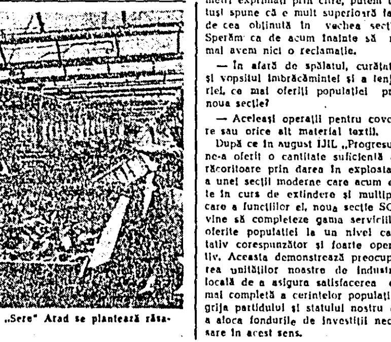
În „grădina fără anotimpuri” a IAS „Sere” Arad se plantează răsadurile viitoare recolte.

construcția ei nu sînt alții decît muncitorii noștri... Iată, așadar, cum au înțeles acești muncitori să răspundă chemării în-