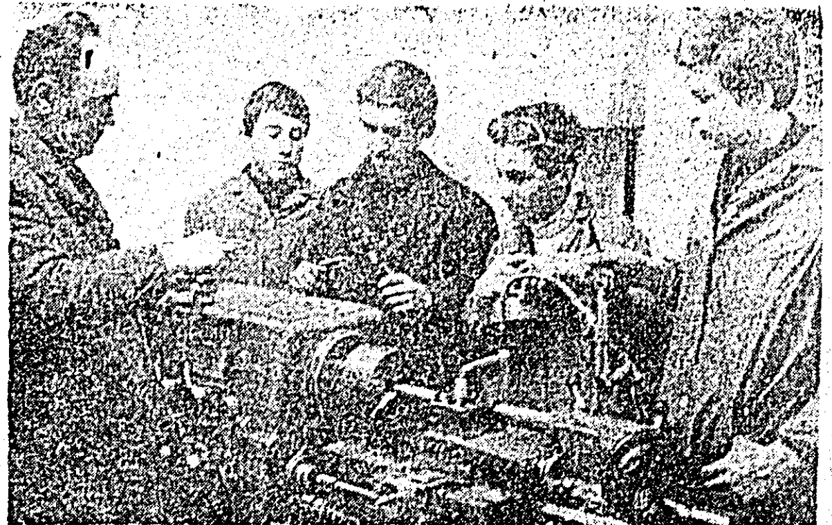
În „microfabrica” liceului, elevii al anului I sînt numai „ochi și urechi” la explicațiile profesorului-instructor.