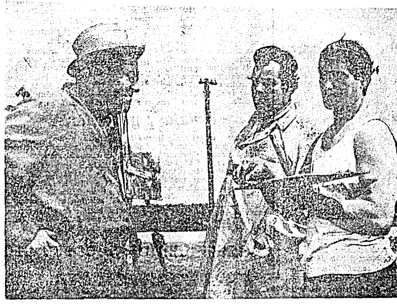
O secvență din filmul „Cerul nu are grații”