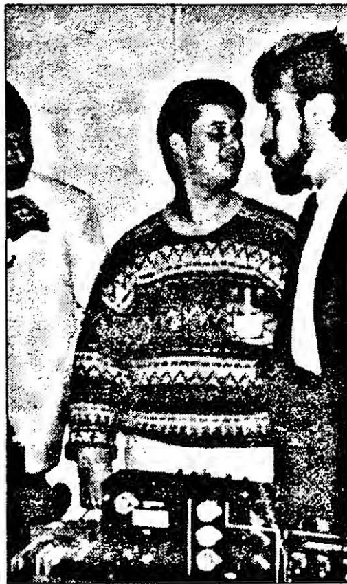
„Renașterea” bărbii este o „Realitate” și în Arad.