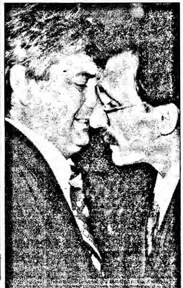
- Ce zici, pe când contabilizăm și cea de-a șasea casă a primarului?