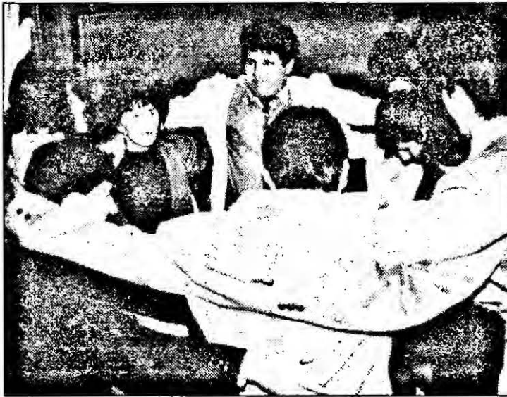
„Ziaristi de toate părțile, uniți-vă”.