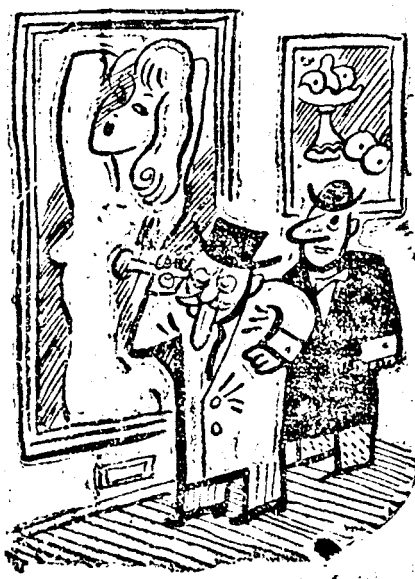
Kép szöveg nélkül.