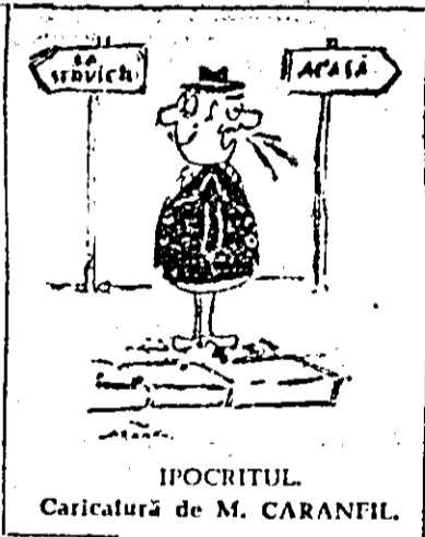
IPOCRITUL. Caricatură de M. CARANFIL.