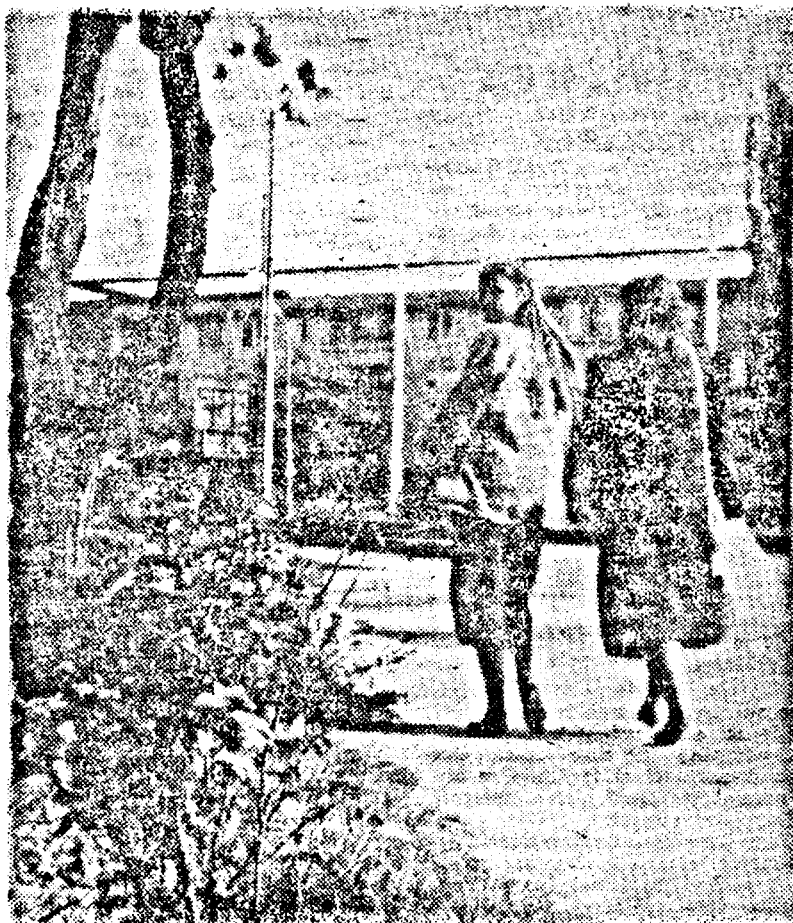
S-AU OFILIT TOȚI TRANDAFIRII