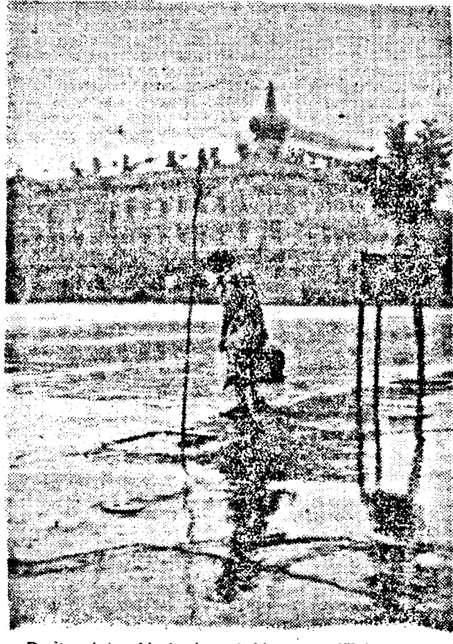
Decît printre bișnițari, mai bine pe celălalt trotuar.