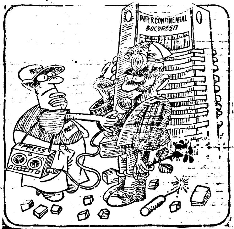
Domnu', noi am venit să culegem trandafirii sădiți anul trecut...

Sperăm că actuala procuratură, deși nu complet purificată de elemente compromise în perioada comunistă, va lua act atît din prezentul articol cît și din sesizare, pe care o vom face, că prescripția nu a estins cauza și că justiția măcar acum își va spune cuvîntul fără presiuni din partea partidului a toate știutorii.