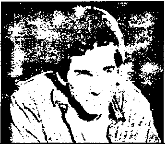
PRO 7 21,15 Moarte strălucitoare - film polițist SUA

18,25 Emisiunea vârstnicilor 19,00 Stiri 19,10 Jurnal regionale