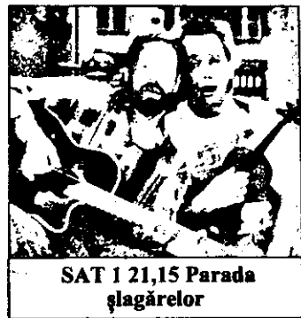
SAT 1 21,15 Parada șlagărelor

7,00 Magazin matinal 10,10 Vecinii - reluare 10,35 Trapper John M.D. - reluare