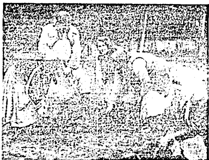
La pepiniera Corbuțiu, se scoat puieții de molid.