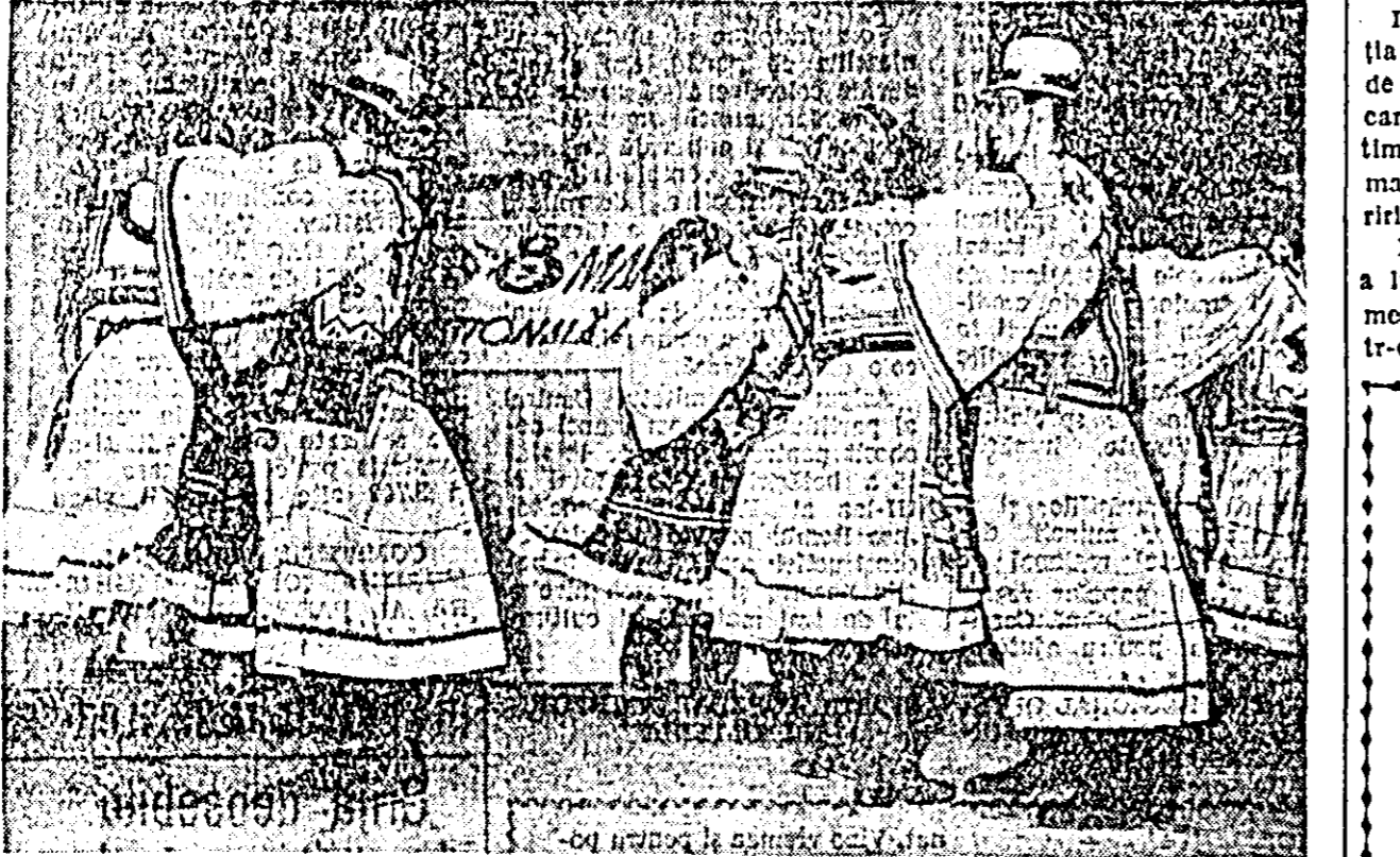
Programul brigăzii artistice de agitație a cooperativei „Vremuri noi” în plină desfășurare.