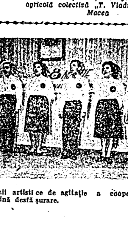
Programul brigăzii artistice de agitație a cooperativei „Vremuri noi” în plină desfășurare.