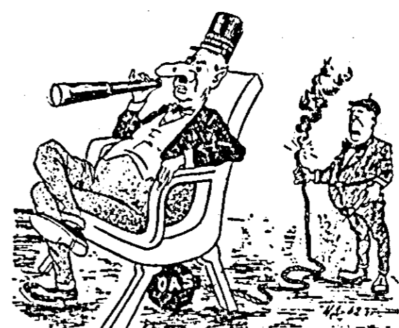
Nu văd nici o primăjdie. desen de N. DATII

La 10 martie, o bandă de asasinii al OAS au plicat o puternică încălțură explozivă în interiorul unei mașini ce staționa în fața clădirii unde urma să-și înceapă lucrările Congresul Național pentru apărarea păcii din Franța. Au fost omorâte două persoane, iar aproximativ 50 au fost rănite.