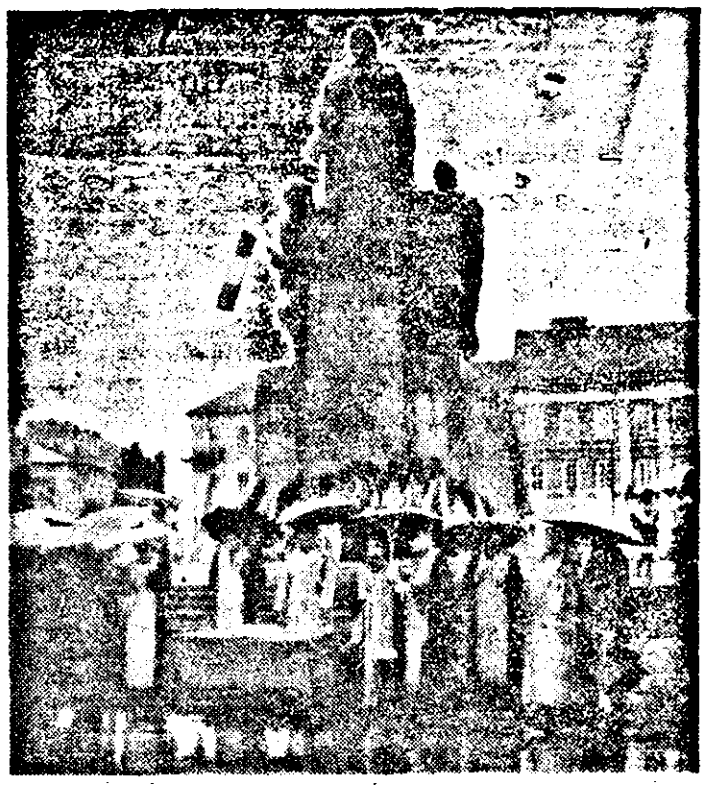
Omăgiu adus Eroilor neamului, cu pioasă recunoștință.