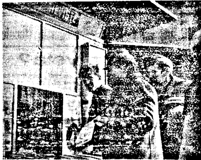
Un ziar tot mai căutat: „Adevărul” de Arad.