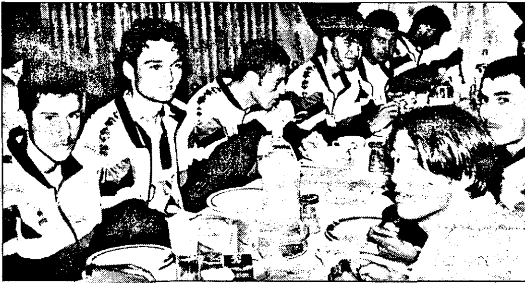
După un antrenament istovitor, urmează masa de prânz (aspect surprins în cantonamentul "Bătrânei Doamne" de la Moncaș).