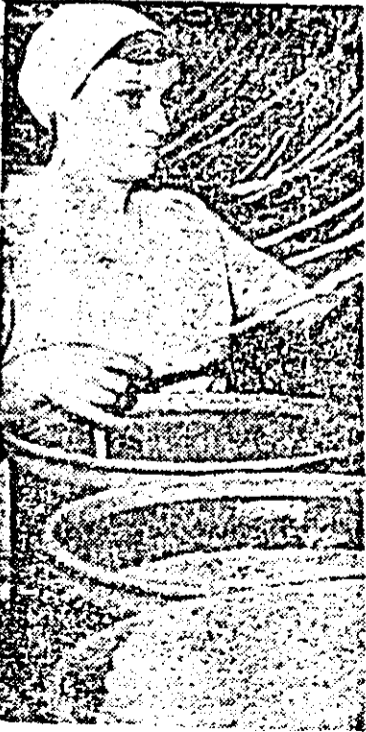
Aurica Ruji, una dintre muncitoarele frontașe de la întreprinderea textilă, un bun exemplu în ce privește grija pentru calitatea produselor.

● În primele rînduri ale preocupărilor pentru ridicarea nivelului calitativ al producției ● Burebista - marele conducător al daco-geților ● Coordonatele unui viitor oraș