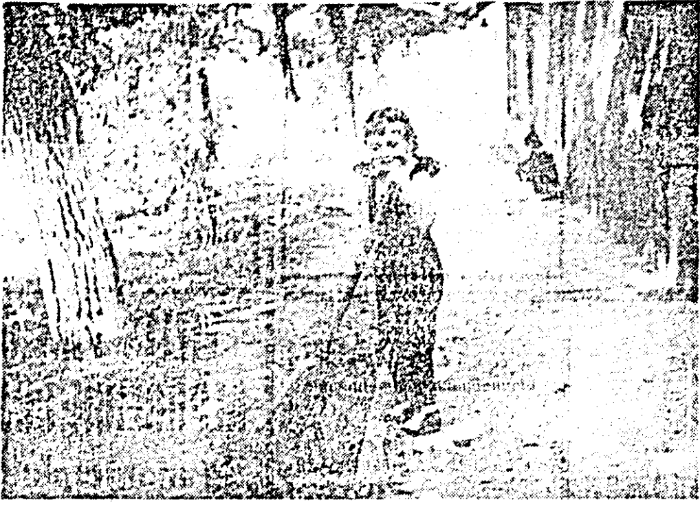
Dimineață de toamnă.

ROMULUS SIICA, Arad: S-au dat dispoziții întreprinderii de locuințe și localuri ca pînă la sfîrșitul acestei luni să transporte molozul din curtea imobilului dv.