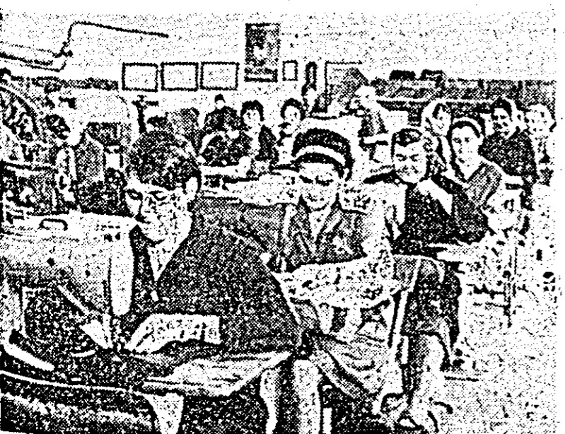
Aspect din secția cusut țefe a fabricii de încălțăminte „Libertatea” Arad.