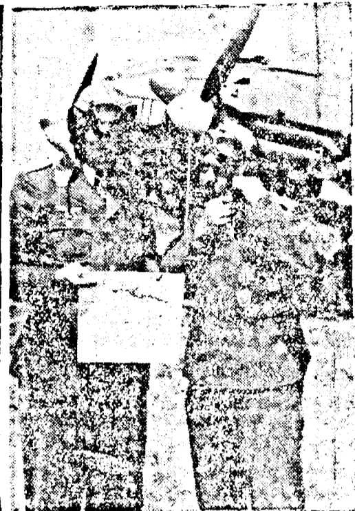
Aviatori germani consultand harta inainte de decolare

Se subliniază deasemeni declarațiile făcute după semnarea pactului de primul ministru japonez Prințul Konoye care a spus între altele că „speră că se vor putea rezolva repede și alte chestiuni în suspensie”. Aceste chestiuni se referă la pescuitul în Marea Okotsk, atitudinea Rusiei față de mareșahul Ciang-Khai-Shek și alte probleme secundare pentru soluționarea cărora pactul de neutralitate va influența în mod favorabil.