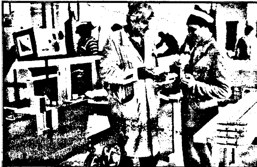
★ În atelierul mecanic, aceeași dotare tehnică cu tehnică de vârf adusă din Germania. ★