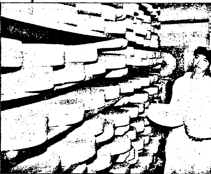
La Sîntana, privatizarea înseamnă nu doar buticuri și baruri, ci și o modernă fabrică de produse lactate.

În comuna Sîntana, într-o fostă clădire particulară, amenajată pentru a corespunde standardelor de igienă, s-a deschis o fabrică de produse lactate. Capacitatea sa este de numai 6000 de litri de lapte, colectat de la producătorii particulari din comună și din localitățile vecine, ba chiar și de la unele societăți agricole mai mari. Astfel, cererile fiind mult mai mari decât capacitatea fabricii, se preconizează extinderea ei pe viitor.