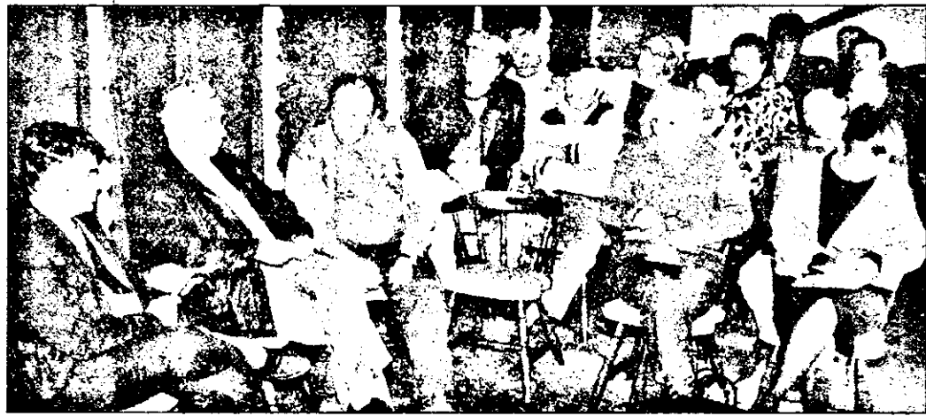
Cititorii și ziaristi, într-un benefic schimb de opinii la Sîntana.