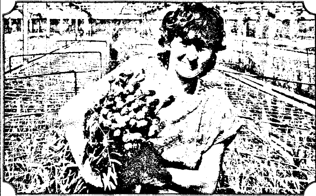
Garoafe roșii și fete frumoase la Sântana.