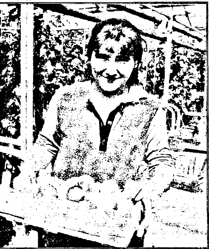
În serele „Romgera” Sintana, am fost asigurați că „la noi se fac cele mai bune roșii”. Și poți să nu crezi?

teren și că plătește toate lucrările, luându-și întreaga recoltă. Dar cum nu toți acționarii dispun de atâția bani, există și varianta în care pentru acest lot personal (de până la 80 la sută) „ROMGERA” plătește toate lucrările, iar omul primește 3000 kg de grâu sau 2500 kg de orz la hectar. Surplusul de producție este reținut de societate în contul lucrărilor efectuate. Deci, indiferent cum a fost anul agricol, asociatul are asigurat 3000 sau respectiv 2500 de kg la hectar. La culturile de prășitoare (porumb, floarea-soarelui, sfeclă), asociații plătesc contravaloarea lucrărilor, iar întreaga producție le aparține. La aceste culturi asociația nu câștigă nimic, câștigă doar oamenii, dar asociația înseamnă, în primul rând, oamenii. În medie, un asociat deține 4-5 hectare de teren. În 1993, de exemplu aceștia au primit de la asociație, socotit valoric, câte 250 de mii de lei pe hectar, plus dividendele de 60-100 de mii de lei de persoană, pentru partea din patrimoniul. În aceste condiții, e ușor de explicat de ce la „ROMGERA” de patru ani nici măcar un singur proprietar nu a ieșit din asociație și de ce la poartă așteaptă mereu „individuali” pentru a fi primiți în asociație. La Sintana răspunsul despre cum e mai avantajos să lucrezi pământul a fost găsit de mult.