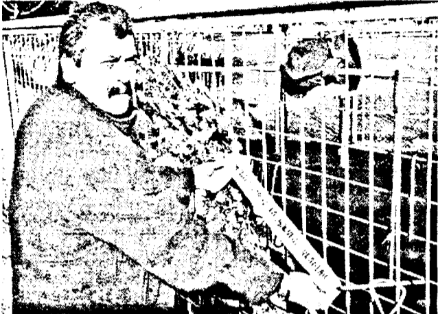
Autoritățile locale au primit o propunere din partea unei firme germane...