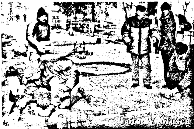
Lădău, mastru de lucrare, care îi îmboldește pe cei 15 subordonați să tragă din greu și cu folos...