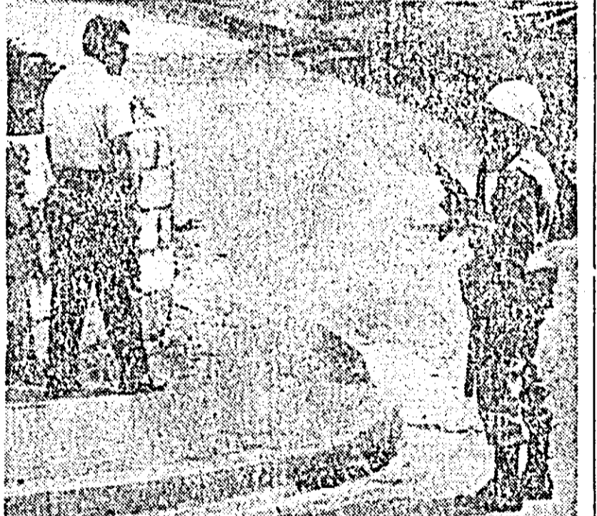
Pe străzile din Santo-Domingo (capitala Republicii Dominicane) circula patrula militară în echipament de război, cu mistuna de a reprimă orice demonstrații ale maselor populare împotriva Juntei militare instaurate la putere.

BRUXELLES 5. (Agerpres). În după-amiaza zilei de 5 noiembrie, a luat sfârșit la Bruxelles sesiunea ministerială a Pieței comune. Potrivit relațiilor Agenției France Presse, sesiunea s-a terminat fără să se fi putut lua vreun hotărâre importantă, mai ales la problemele legate de elaborarea unei politici agrare comune, problema unde persistă contradicții serioase între Franța, care a cerut a probarea unor prețuri comune la cereale, carne de vită, orez etc. și Republica Federală Germană, care refuză cererea franceză.