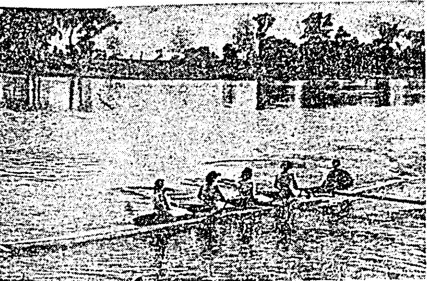
IN CLIȘEU: un echipaj de 4+1 rame fete în timpul antrenamentului.

Cea de-a doua lucrare, cu titlul „Lupta pentru refacerea și dezvoltarea mișcării muncitorești între 1900 și 1917”, cuprinde, printre altele, capitolele: „Mișcarea muncitorească din țara noastră între 1900 și 1905”, „Răscola țărănilor din 1907”, „Crearea Uniunii socialiste din România. Lupta pentru refacerea partidului politic al clasei muncitoare”.