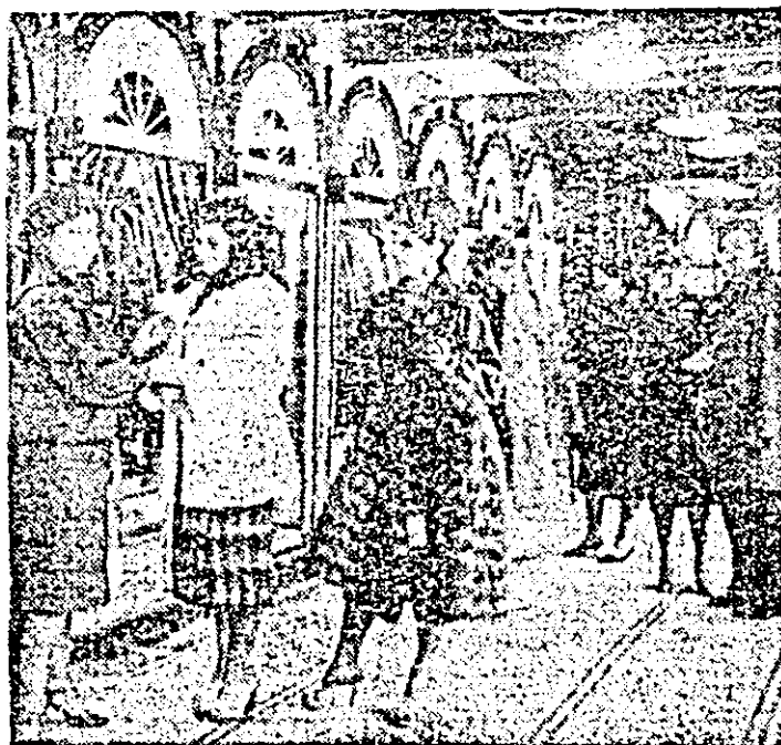
Aspect din noul magazin cu articole de blăndărie recent deschis în municipiu, B-dul Republicii nr. 68.