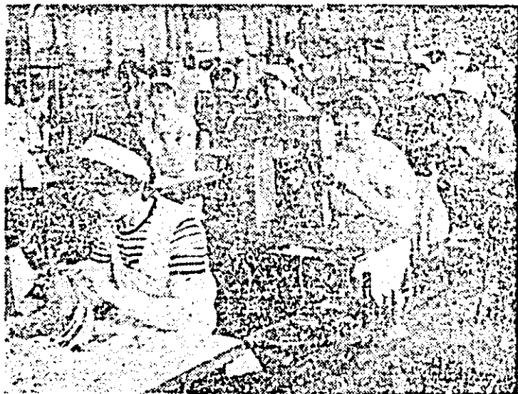
Aspect de muncă în secția pregătirii-cusut a întreprinderii „Libertatea”.