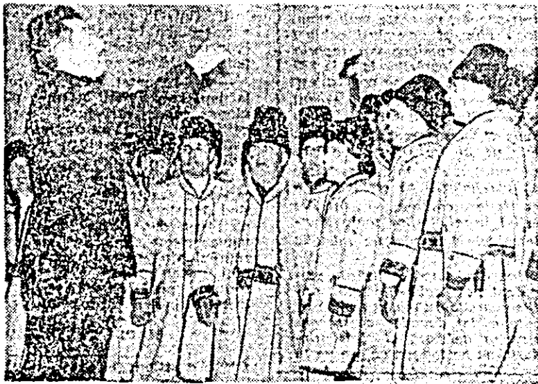
Alături de formațiile de teatru de amatori, cele de montaj literar-artistice aduc în scenă întotdeauna un vibrant mesaj patriotic. Formația de montaj literar-artistice a căminului cultural din Bîrsa (în imagine), de mai multe ori înalțată și laureată a concursurilor artistice de amatori, a fost distinsă nu demult cu un binemeritat loc III la Festivalul național „Cîntarea României”.