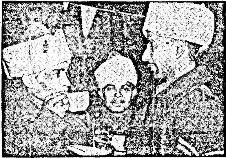
Pe frontul de Vest

Un convoi britanic atacat de avioanele germane. Pe uscat tiruri de artilerie și infanterie