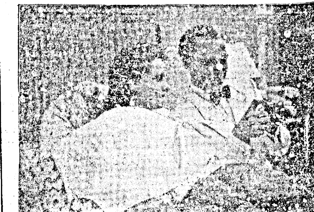
Olga Tschehowa și Paul Klinger în noul film al casei Tobis: „Verliebt in Abenteuer”

Astăzi lectura a trecut pe al doilea plan și pe primul stă viața, trăirea, acest dar de a trăi și ști exprima emoțiile, se răsfrânge și în rolurile grele — cum e cel al lui Annelie în viitorul ei film „Povestea unei vieți” (ea întruchipează aici destinul unei femei, în toate întâmplările vieții până la capătul acestei lumi) pe care le poate realiza numai datorită puternicului alesului ei fond sufletească.