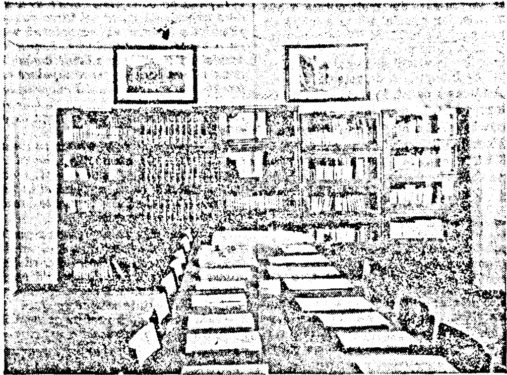
Biblioteca Institutului de Cultură Italiană, secția Timișoara.