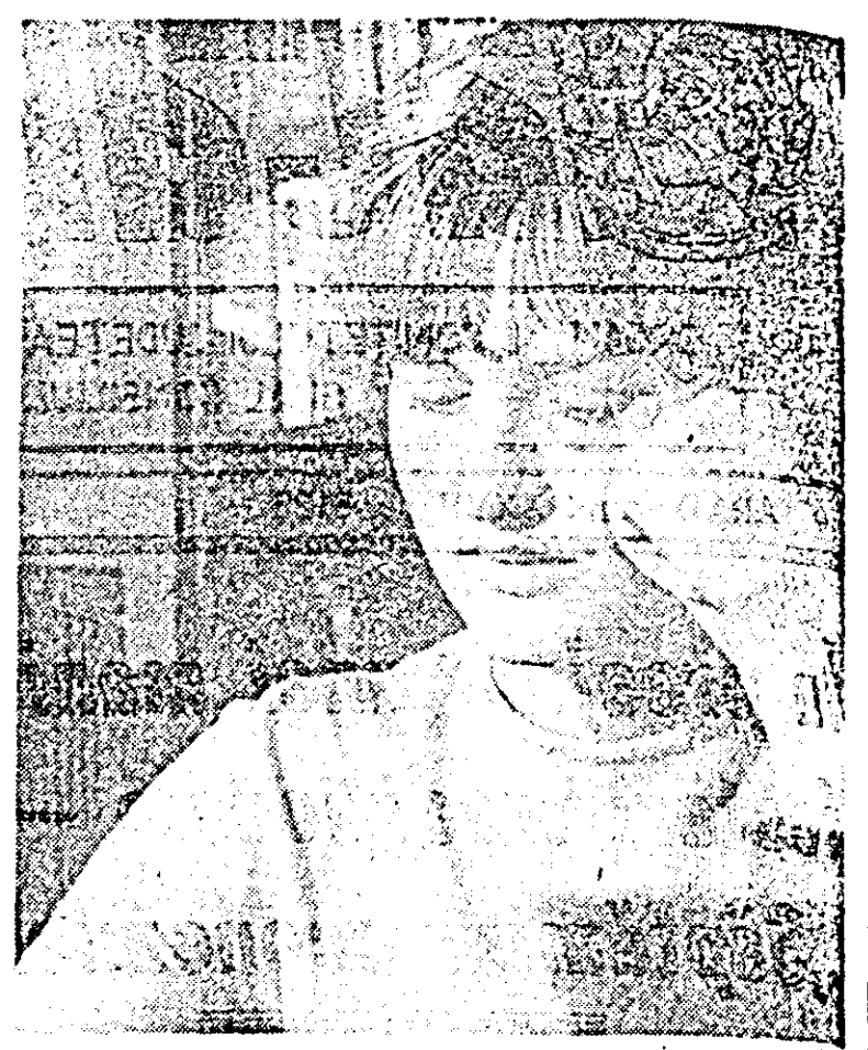
Ceasurile meditației și ale lecturii, surse de bucurii superioare.