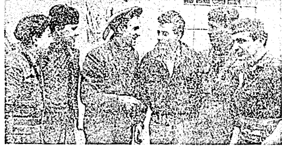
Brigazii de tineret „Unirea” de la fabrica „7 Noiembrie” l-au fost încredințate lucrările de modernizare a instalațiilor electrice din secția lăchilor.

Printre o mal bună organizare a muncii și prin mal multă disciplină din partea fiecărui muncitor, în țesătorie s-au realizat peste planul lunar 12.000 m. p. țesături, iar la filasaj s-au dat peste plan 18.232 m. p. țesături. Printre celo mal a-preciabile rezultate, aratăm că uzina și-a realizat și în această lună planul pe sortimente, în celo mal bune condiții.