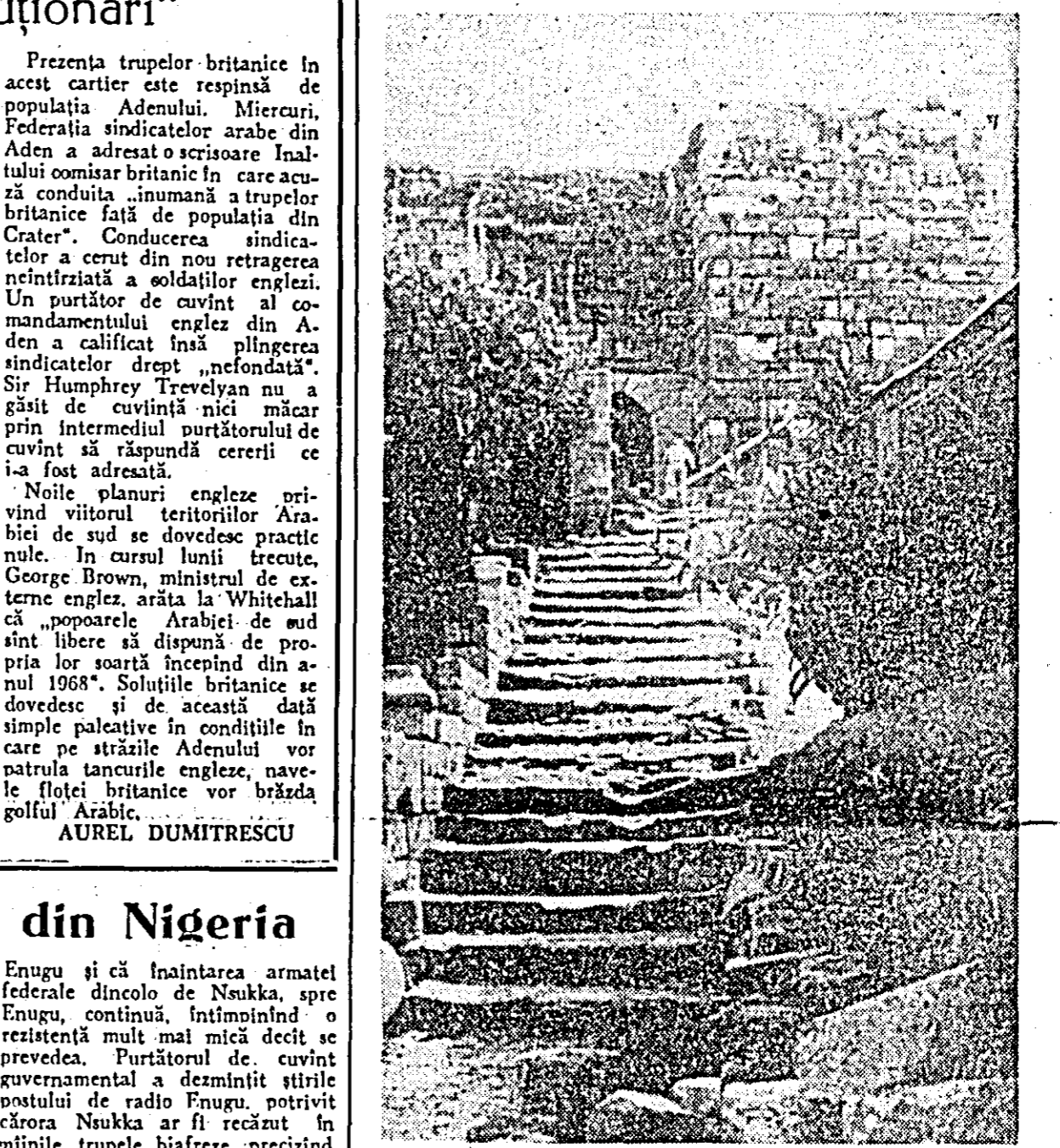
BYBLOS — oraș antic din Liban, locuit înainte cu 7.000 de ani de fecienți.