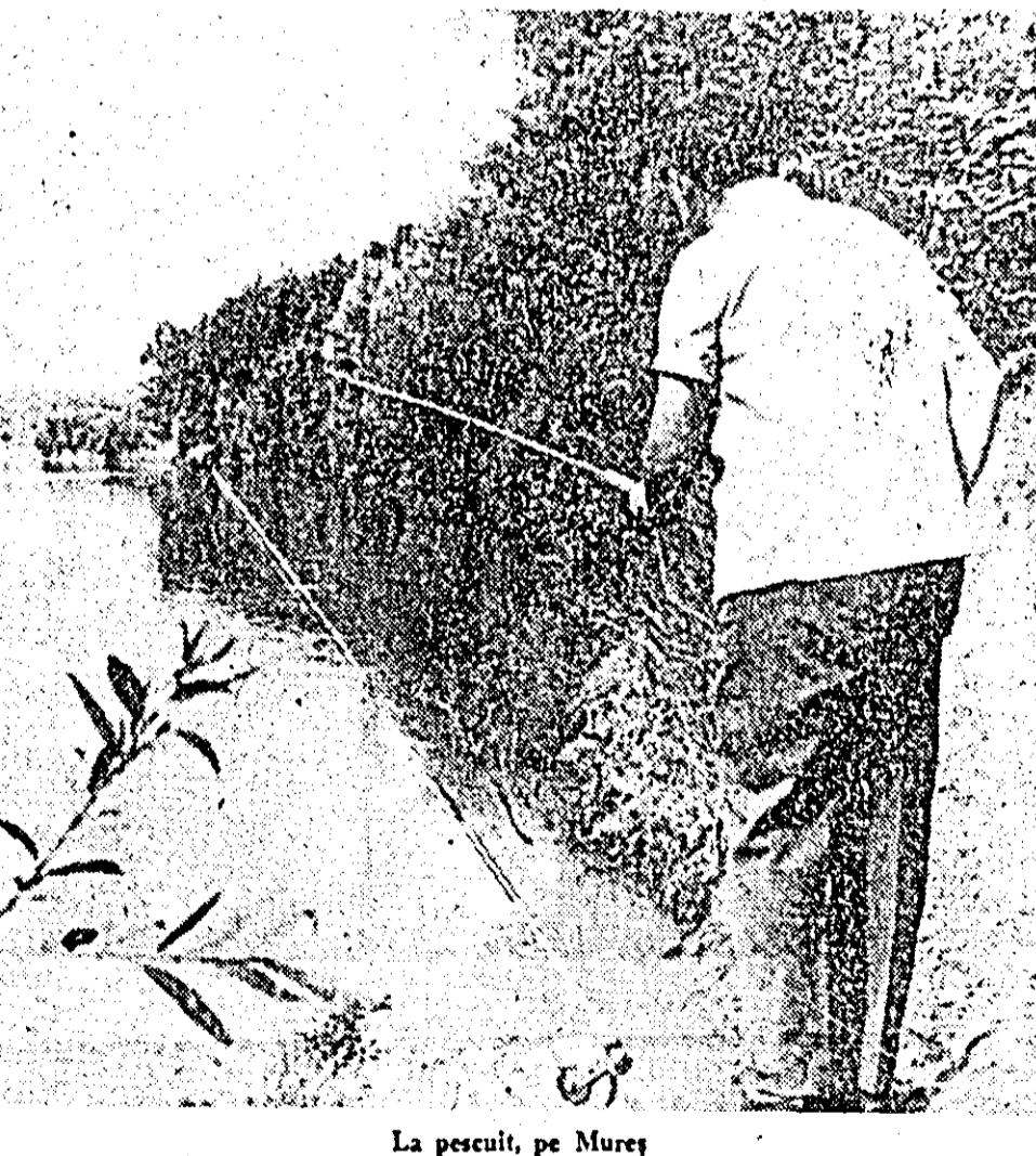
La pescuit, pe Mureș