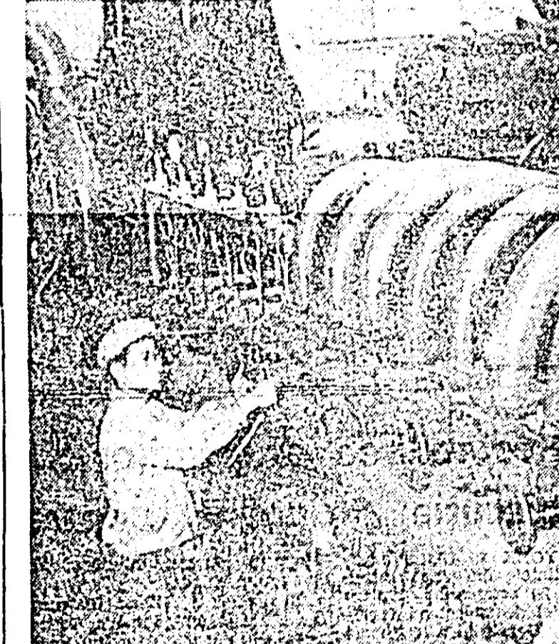
Lucrările de mărire a capacității fabricii de produse chimice de la Aoji (R.P.D. Coreeană) s-au terminat de curînd. Pînă în anul 1967 ultimul an al planului de 7 ani al R.P.D. Coreeană — producția anuală a acestei fabrici va atinge 90.000 tone. În CLUȘEU: Aspect din instalația de desulfurizare a fabricii.

Lucrările de construire a sistemului de irigare Amnokkan din provincia Phenianul de nord — cel mai mare sistem de irigare din RPD Coreeană, înaintează cu succes. Canalul va fi dat complet în exploatare în primăvara anului 1964. În prezent sînt în curs de terminare lucrările pentru construirea barajului lacului de acumulare Mbekons și a canalelor magistrale de scurgere a apei. Pe barajele sistemului de irigare se vor construi mici centrale electrice care vor produce anual 25.000 kWh energie electrică.