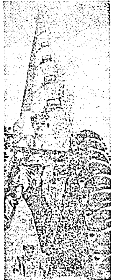
Acest coș al combinatului chimic de la Coswig (R.D. Germană) are o înălțime de 120 metri.