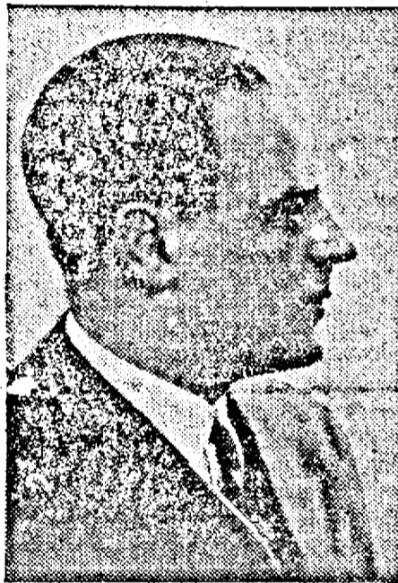
D. GRIGORE GAFENCU

Suntem gata să ne facem datoria către țară. Armata noastră, streină de orice gând de agresiune, stă de veghe la hotare. Nu ne-am dat în lături dela nici o colaborare ce ne-a fost oferită pentru a întări stările