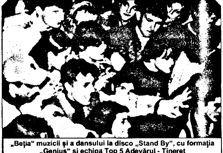
„Beția” muzicii și a dansului la disco „Stand By”, cu formația „Genius” și echipa Top 5 Adevărul - Tineret

cu doi ani în urmă am contactat-o și am pus la cale trupa. - Voi trei v-ați întâlnit, ce v-ați fizis: hai să punem la cale de-o trupă... - Da, cam așa! - Și când ați scos primul