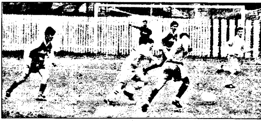
Luptă surdă pentru balon în derby-ul dintre „Universitatea” și Lipova.

deloc întâmplătoare. În ceea ce-i privește pe Socodor, vremuri grele se arată! ▼ La Ineu, Jușcă și com-