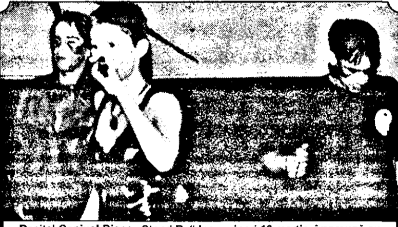
Recital Genius! Disco „Stand By” Ineu, vineri 13 martie, împreună cu echipa Top 5 Adevărul - Tineret