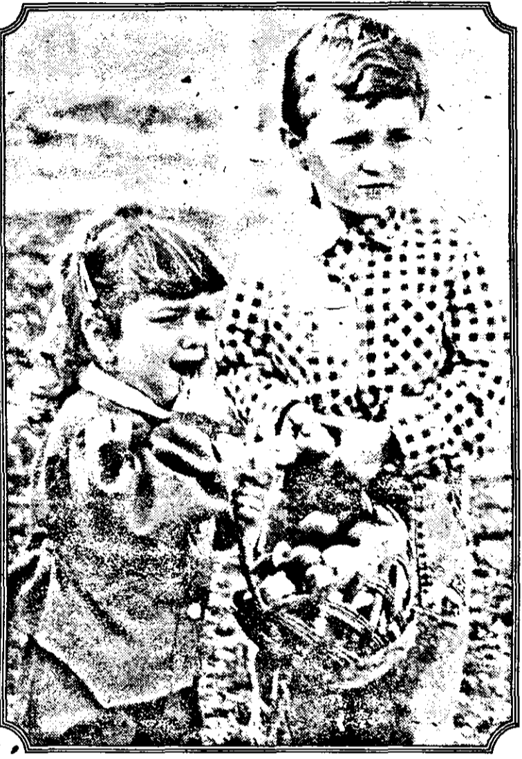
Numai ouă ne-a adus Iepurașul?